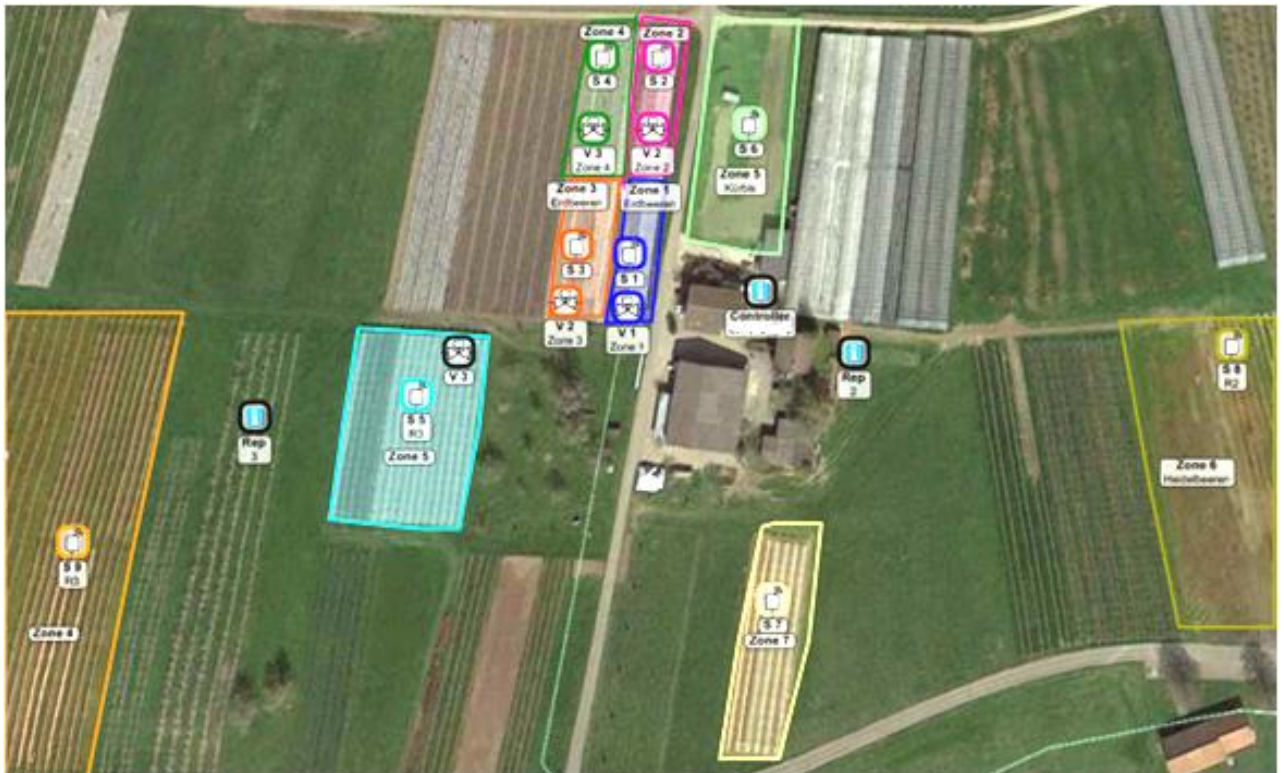
Abb.2: Anordnung der bewässerten Zonen, der Sensoren und Ventile

Nach Meinung von Fachleuten ist es sehr wichtig, dass die Erdbeerkulturen weder zu trocken, noch zu nass sein sollten. Zu trocken führt zu kleinen Früchten oder sogar zu Trockenstress und zur Reduktion des Ertrages. Zu hohe Feuchte führt zu erhöhter Anfälligkeit für Pilzbefall und ebenfalls zu reduziertem Ertrag. Die mittlere Bodenfeuchte sollte jedoch im oberen Bereich liegen.